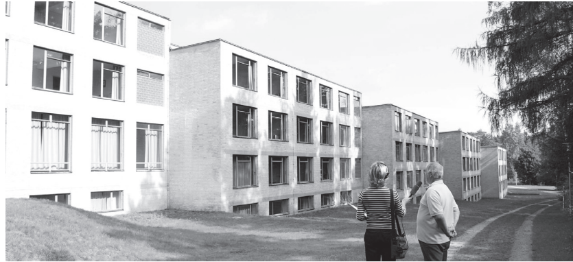
Bundesschule Bernau

Das besondere dieses Objektes ist, dass die Anlage zu den eindrucks-