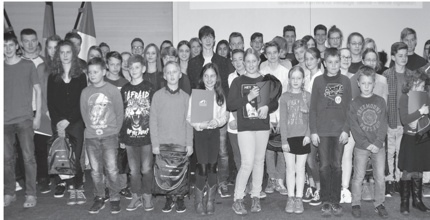
Wettbewerbsteilnehmer auf der Landespreisverleihung in der Staatskanzlei