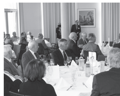
Frühjahrsempfang 2017