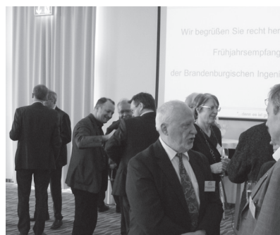
Konstruktive Gespräche