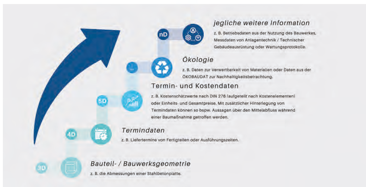
Abbildung 1: Die Methodik kann je nach Informationsgehalt der Modelle anhand unterschiedlicher Dimensionen beschrieben werden. So spricht man z. B. von einer 5D-Modellierung, wenn die zur Anwendung kommenden Modelle sowohl Termin- als auch Kostendaten beinhalten.

Im Mittelpunkt der Methodik stehen die Informationen, die den einzelnen Bauteilen zugeordnet werden. Man spricht dabei auch von Bauteilattributen. Prinzipiell können jegliche Informationen, also auch Dokumente, Fotos und Videos, mit den Bauteilen (Modellobjekten) verknüpft werden. Die BIM-Modelle werden somit zum zentralen und nachhaltigen Instrument zur Datenhaltung und -übermittlung.