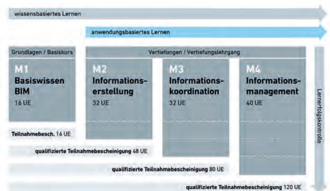
Abbildung 4: Modularer Aufbau SDAIK

Das Qualifizierungsprogramm des BIM Standards führt die Teilnehmenden praxisnah und unter Anleitung erfahrener Dozenten mit einschlägiger BIM-Expertise an die BIM-Methode heran. Neben dem Kurs „Basiswissen BIM“, der die theoretische Grundlage bildet, wird seit 2021 auch ein darauf aufbauender drei Module („Informationserstellung“, „Informationskoordination“ und Informationsmanagement“) umfassender Vertiefungslehrgang angeboten, der eine solide Grundlage bildet, um Leistungen der Objektplanung mit BIM-Gesamtkoordination erbringen zu können.